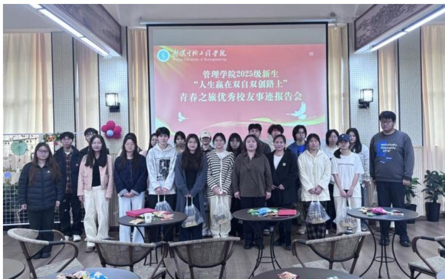
管理学院创业之家分享会合影