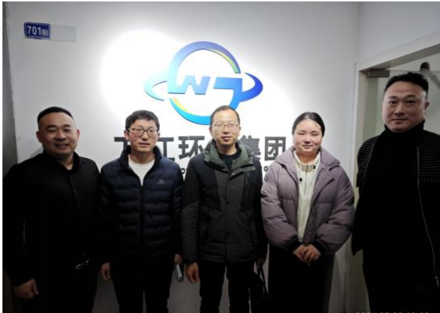
走访湖北万江环保集团有限公司