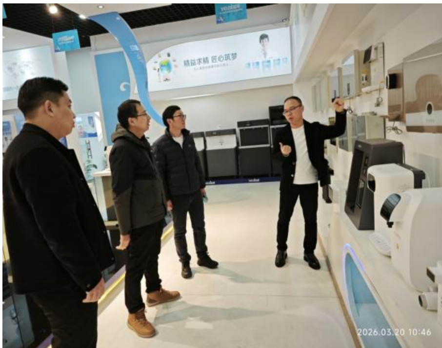
走访武汉溢爱环保实业有限公司