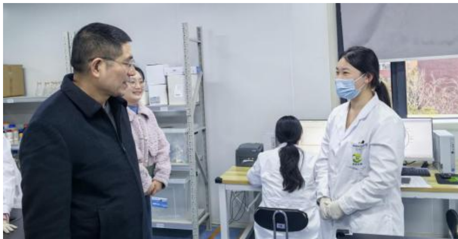
江珩与淼灵生物在岗校友亲切交流