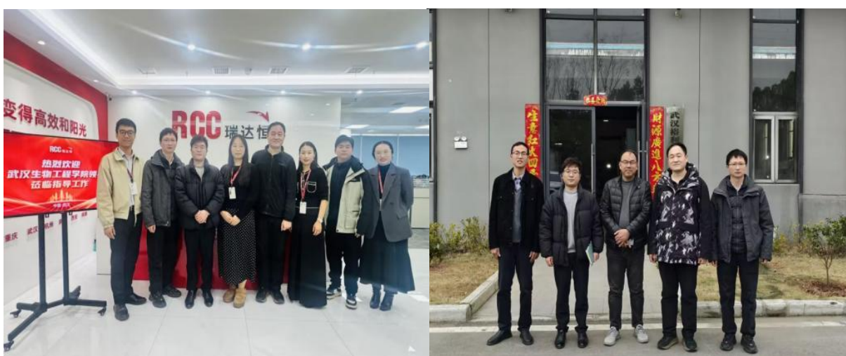
空间智能与工程学院走访企业合影

3月4日，空间智能与工程学院走访工作组先后前往RCC瑞达恒建筑咨询公司武汉分公司、裕利辉建设工程有限公司开展走访调研，同步看望慰问在企就职校友，关切询问工作、生活情况。学院诚邀两家企业参加学校春季招聘会，后续将加快合作意向落地，持续拓展就业资源，完善校企协同育人机制。