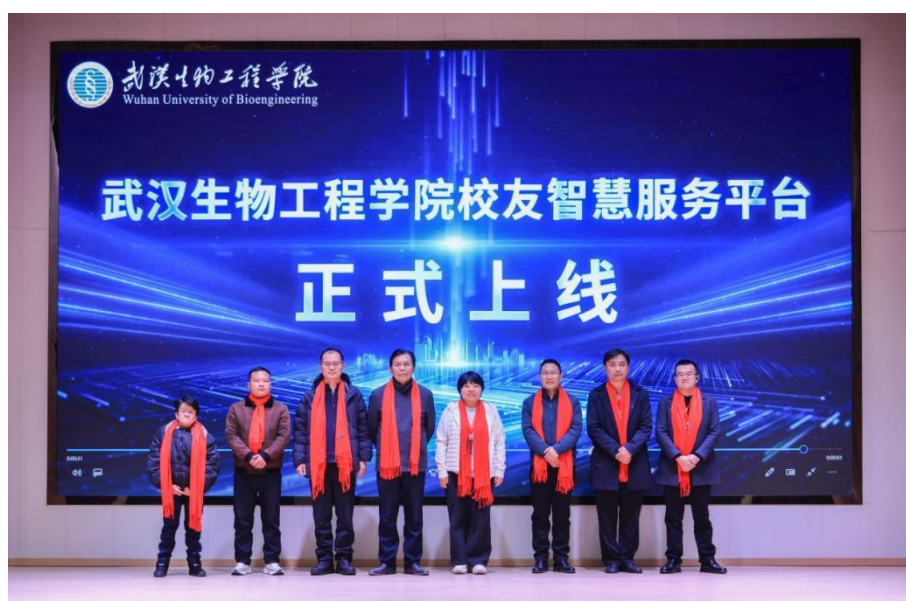
校友信息化平台上线启动仪式

学校招就处、科发处分别就人才培养与科研合作作专题发言。会上，举行了校友信息化平台上线启动仪式，标志着校友工作正式迈入数字化、智能化的 2.0 时代。