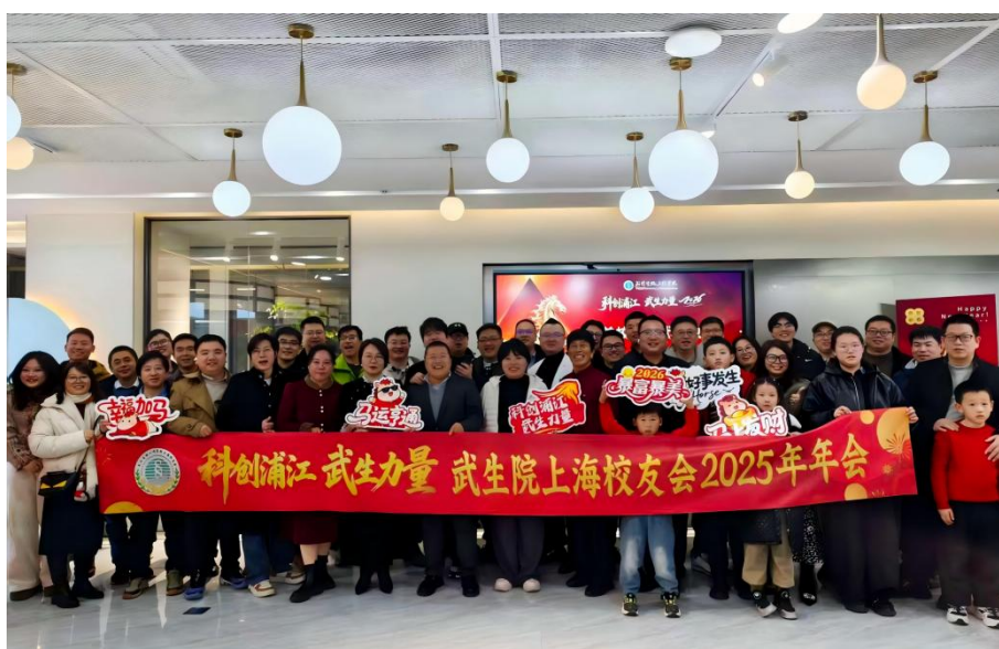
上海校友会校友年会合影

2月1日，上海校友会以“科创浦江，武生力量”为主题，在上海市闵行区龙马环球举行2025年度校友联谊会。活动由上海校友会秘书处精心组织，共有40余位在沪校友及家属踊跃参与，温情满满。年会总结了过去一年上海校友会在商务交流、校友互动等方面取得的丰硕成果，并展望2026年发展新目标。