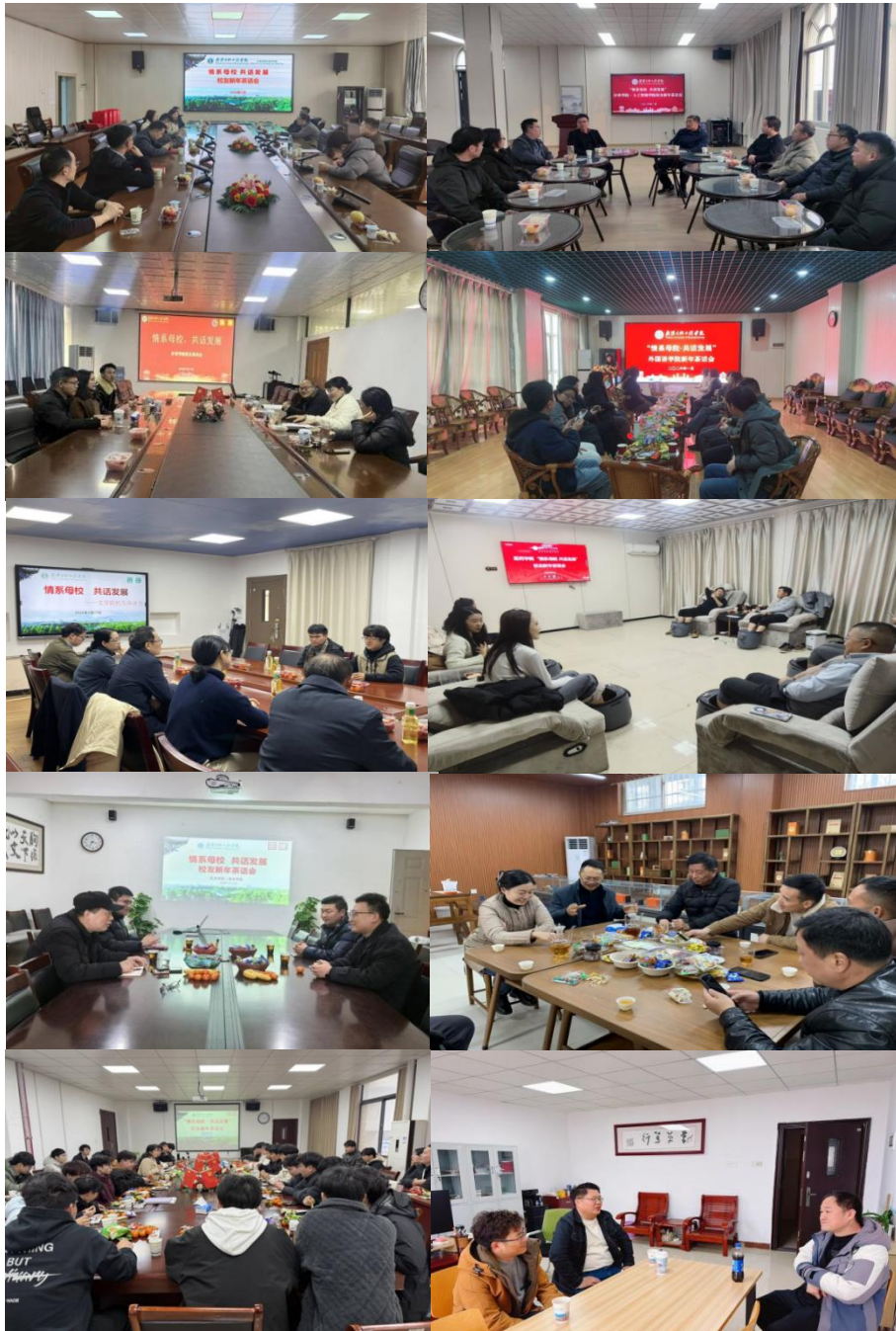
各学院校友茶话会现场