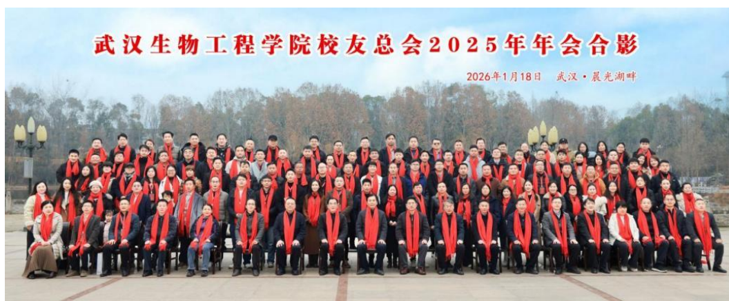
武汉生物工程学院校友总会 2025 年年会合影