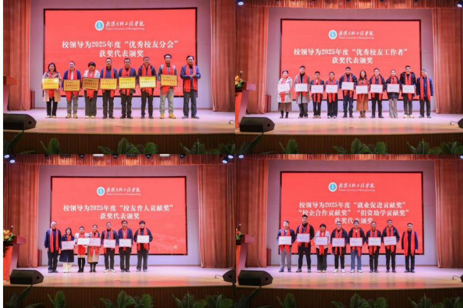
校领导为 2025 年度校友工作获奖代表颁奖

学校招就处、科发处分别就人才培养与科研合作作专题发言。会上，举行了校友信息化平台上线启动仪式，标志着校友工作正式迈入数字化、智能化的 2.0 时代。