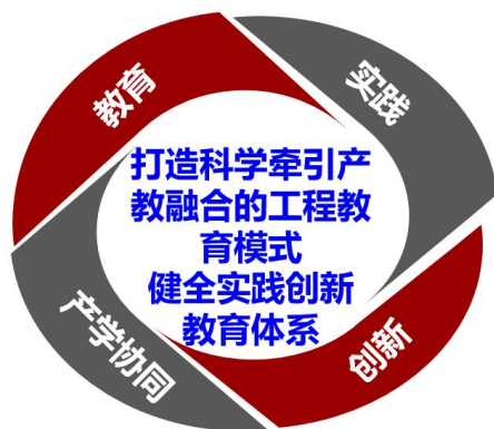
工学院产教融合育人模式图

针对不同培养阶段建立多层次开放实践平台，推动学科交叉融合及创新创业实践，探索校企合作育人的培养模式。联合航天科工集团、中国船舶集团、北京医疗机器人创新中心、KUKA 机器人、新奥集团、天智航、中秦兴龙等企业和研究单位建立了合作与实践平台、创新基地，积极探索产教融合育人模式。学院提出并建设“业界导师”项目，在增进学生对工程理解的同时，推进人才培养紧贴产业发展，保证人才培养的前沿性和动态性。至今已举办七届“工行天下”业界导师活动，参与导师百余位，惠及学生近千人。与此同时，学院将实践参访与就业实习相融合，鼓励学生走出校园、走向一线，开展丰富的实践活动。仅2020-2021 年便累计参访了包括腾讯、京东方在内的 20 多家用人单位，涵盖了航天科工院所、先进制造企业、教育单位等不同领域领头单位积极联系地方政府和优质企业，建立实习实践基地，为学生实习实践提供相应的条件。